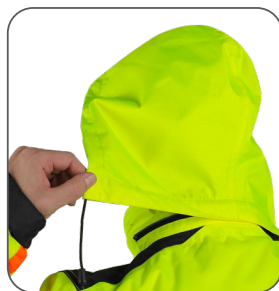
odepínací kapuce odopínateľná kapučňa detachable hood odpinany kaptur