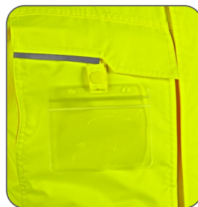
náprsní kapsa s odnímatelným pouzdrém ID karty náprsné vrecko s odnímateľným držiakom na ID karty chest pocket with detachable ID card holder kieszeń na piersi z miejscem na ID kartę